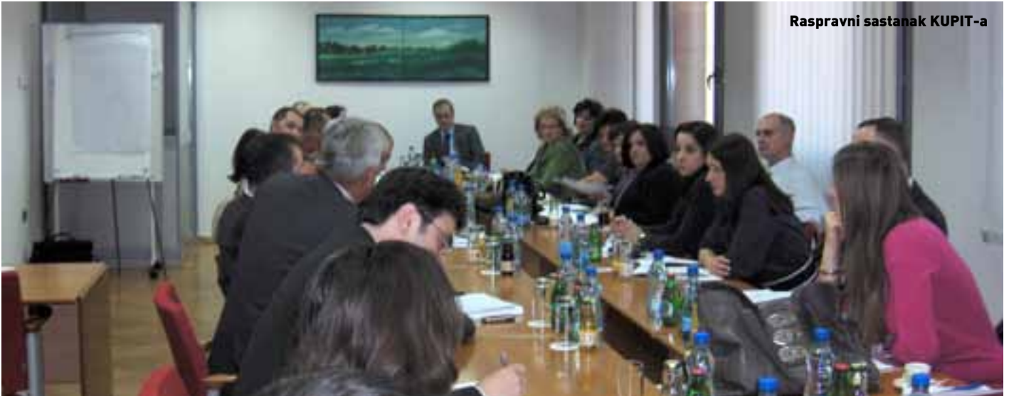
Raspravni sastanak KUPIT-a