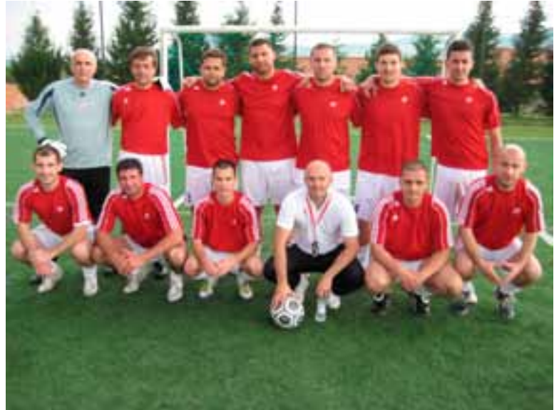
UniCredit bank - pobjednici u malom nogometu

Uvjerljivu pobjedu u malom nogometu odnijela je UniCredit Bank Mostar. Dalibor