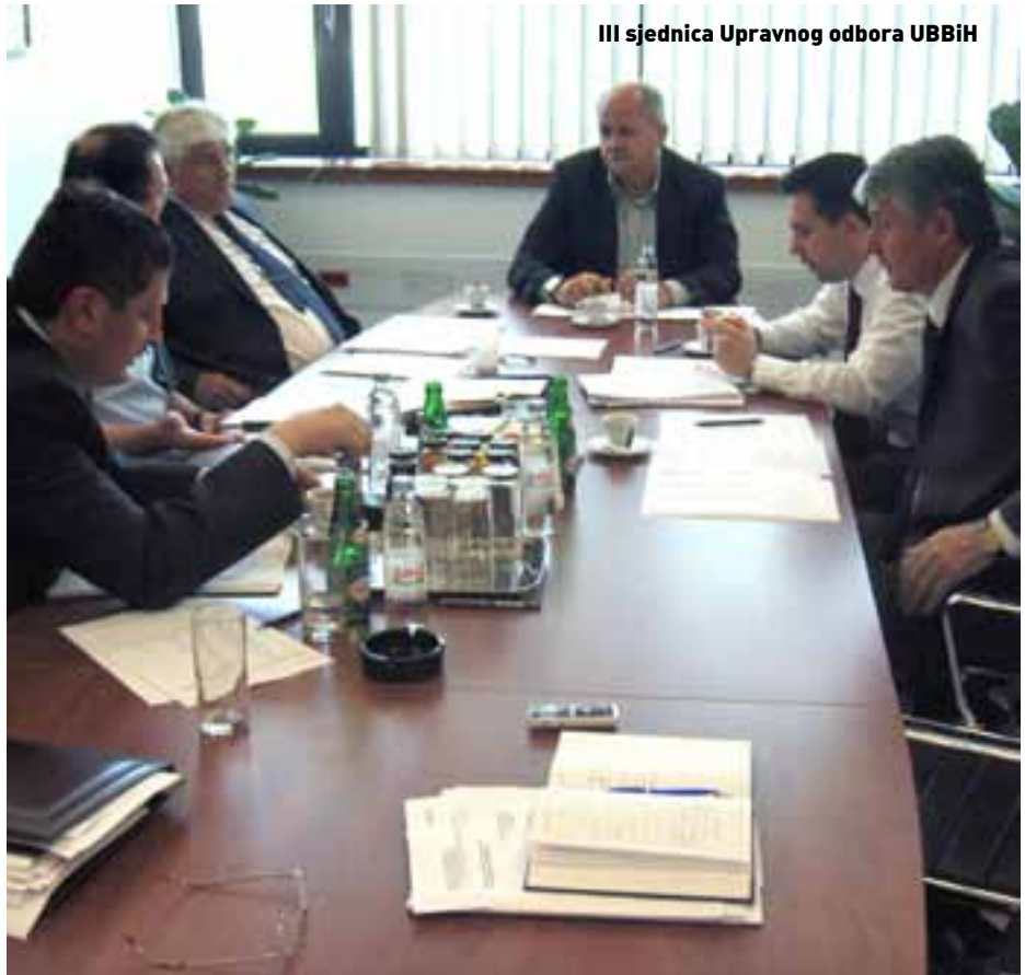
III sjednica Upravnog odbora UBBiH

Poslije sjednice Upravnog odbora u prostoriju "Panorama", u Uniticu, održano je druženje sa novinarima.