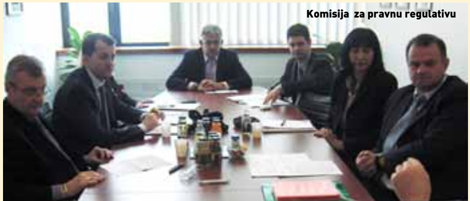
Komisija za pravnu regulativu