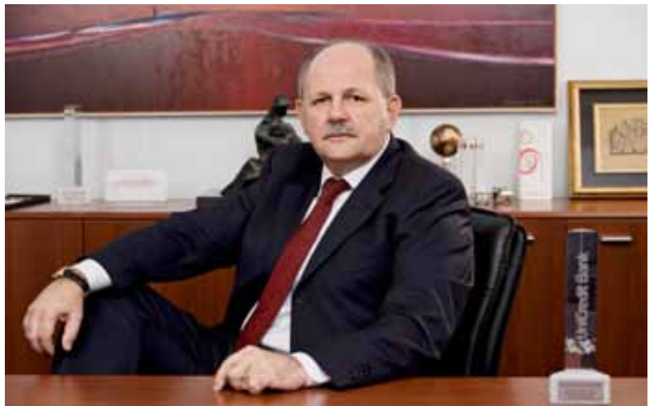
Berislav Kutle, predsjednik UBBiH

Sve zemlje jugoistočne Europe i Bosnu i Hercegovinu, unatoč ekonomskim i drugim specifičnostima, nesumnjivo odlikuje sporiji tempo ekonomskog oporavka, jednoznačno određen vanjskim neravnotežama, fiskalnim deficitima i strukturnim manjkavostima, kao i visokoj ovisnosti o stranim ulaganjima. Ovi momenti s ekonomskog kuta gledanja nameću potrebu izmjene i jačanja njihovih unutarnjih proizvodnih potencijala. Svakako, zajednička je ocjena da bi sve zemlje regije, pa i one koje tijekom 2010. godine nisu izašle iz recesije, trebale bilježiti pozitivne stope rasta ekonomskih aktivnosti u ovoj i narednoj godini.