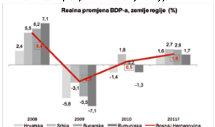
Grafikon 2: Realna promjena BDP-a u zemljama regije