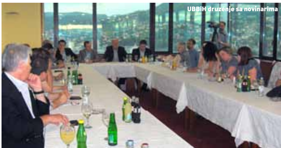
UBBiH druženje sa novinarima

Cijelo druženje svojim novinarskim peplom zabilježila su 23 novinara iz 17 novinskih i TV kuća, a svi prisutni uz izraze oduševljenja izrazili su i želju za što skorijim ponovnim susretom.