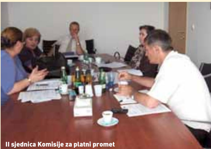
II sjednica Komisije za platni promet